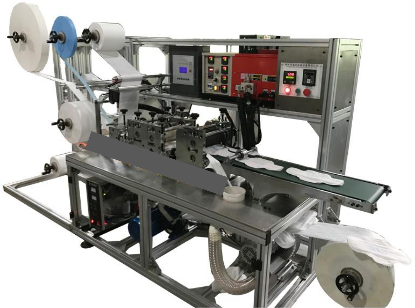
Semi Automatic Ladies Sanitary Napkin Pads Making Machine